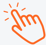
TABLE RONDE :

Modèles de relations informels et ouverts, basés sur des intérêts communs et servant avant tout à l'échange de connaissances