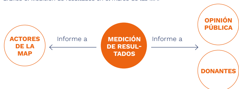
Gráfico 3: Medición de resultados en el marco de las MAP

La medición de resultados es relevante y esencial en muchos aspectos: sirve para la rendición de cuentas ante el donante, el grupo destinatario y los actores activos en la MAP. La medición de resultados, en cualquier caso, no debe entenderse como un mero control, sino como un instrumento para y del sistema de seguimiento y evaluación, que documenta los éxitos y asegura el aprendizaje.