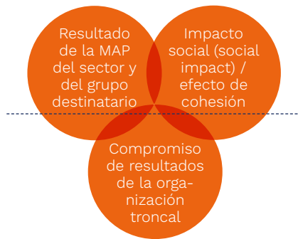
Gráfico 2: Resultado de la MAP — 3 vertientes

Además, para las secretarías y para las organizaciones troncales de las MAP, es útil comprender y considerar el resultado en el propio seno de forma separada de los resultados de la MAP en su conjunto, tal como se refleja en el gráfico 2.