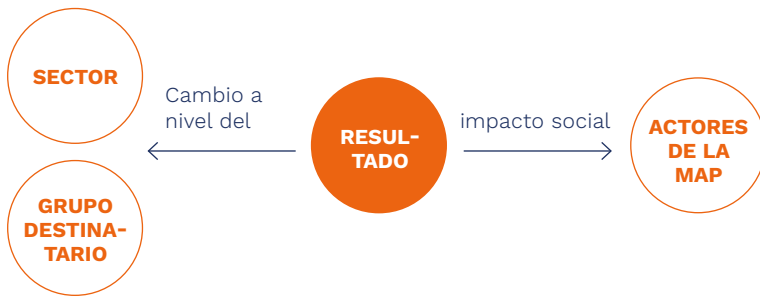
Gráfico 1: Resultado en y de las MAP

En comparación con el resultado de los proyectos convencionales, el resultado de las MAP presenta un componente adicional, pues, en estas, los resultados se generan, por un lado, a nivel del grupo destinatario y del sector –como en los proyectos–, y, por el otro, también a nivel de los actores que integran la MAP, tal como se refleja en el gráfico 1. El resultado a nivel de los actores que integran la MAP se denomina impacto social (social impact) o efecto de cohesión.