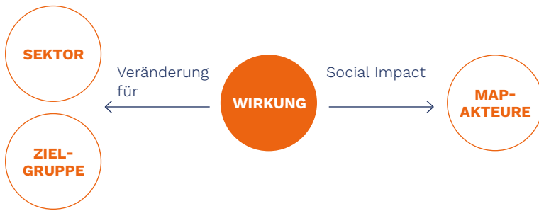
Grafik 1: Wirkung in und von MAP

Die Wirkung von Multi-Akteurs-Partnerschaften hat im Vergleich zu klassischer Projektwirkung eine zusätzliche Komponente, denn Wirkungen von MAP richten sich zum einen – wie Projekte – auf die Zielgruppe und den Sektor, und zum anderen zusätzlich auf die Akteure innerhalb der MAP, wie in Grafik 1 dargestellt. Die Wirkung auf die Akteure innerhalb der MAP wird hier als Social Impact oder Kohäsionswirkung bezeichnet.