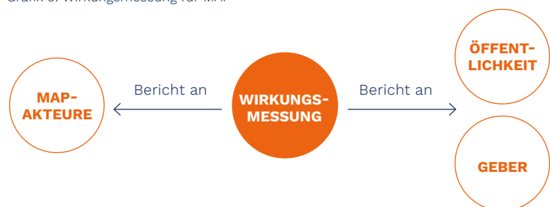
Grafik 3: Wirkungsmessung für MAP

Wirkungsmessung ist aus vielerlei Hinsicht relevant und essentiell – es dient der Rechenschaftspflicht gegenüber dem Geldgeber, der Zielgruppe und für die Akteure, die in der MAP aktiv sind. Wirkungsmessung ist dabei nicht nur als Kontrolle zu verstehen, sondern als Instrument für und Bestandteil von Monitoring & Evaluation (M&E), um Erfolge zu dokumentieren und Lernen sicherzustellen.