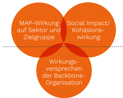
Grafik 2: Wirkung und MAP – 3 Blickrichtungen

Zudem ist es für Sekretariate bzw. Backbone-Organisationen von MAP hilfreich, die eigene Wirkung gesondert von Wirkungen der gesamten MAP zu verstehen und zu betrachten, wie in Grafik 2 dargestellt.